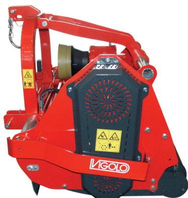
Parapiante lato carter