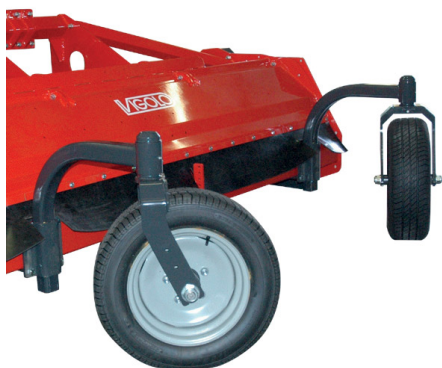
Ruote posteriori in gomma